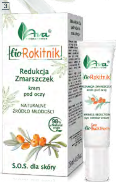
3 KREM POD OCZY REDUKCJA ZMARSZCZEK 15 ml • indeks 6123