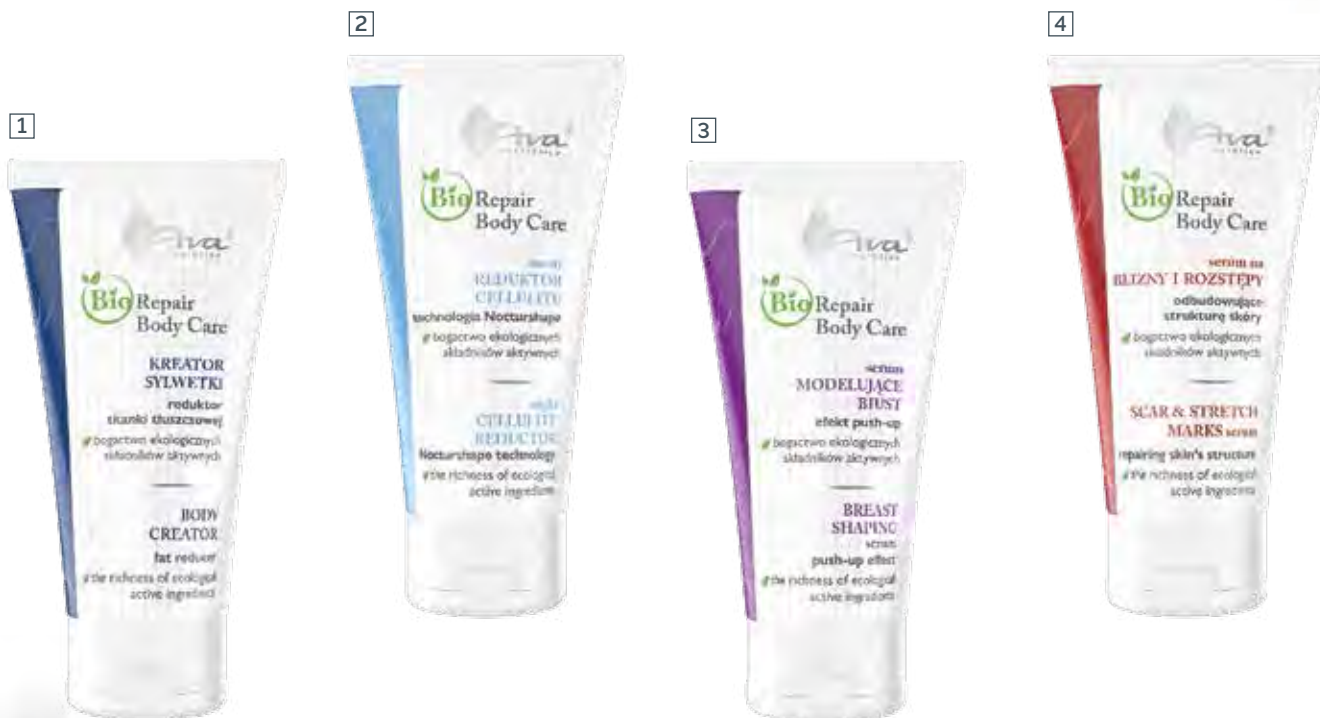
1 KREATOR SYLWETKI REDUKTOR TKANKI TŁUSZCZOWEJ 150 ml • indeks 4778

PRZEZNACZONY DO KAŻDEGO RODZAJU SKÓRY, Z WIDOCZNĄ UTRATĄ JĘDRNOŚCI I CELLULITEM ORAZ DO PIELĘGNACJI SKÓRY PO CIĄŻY.