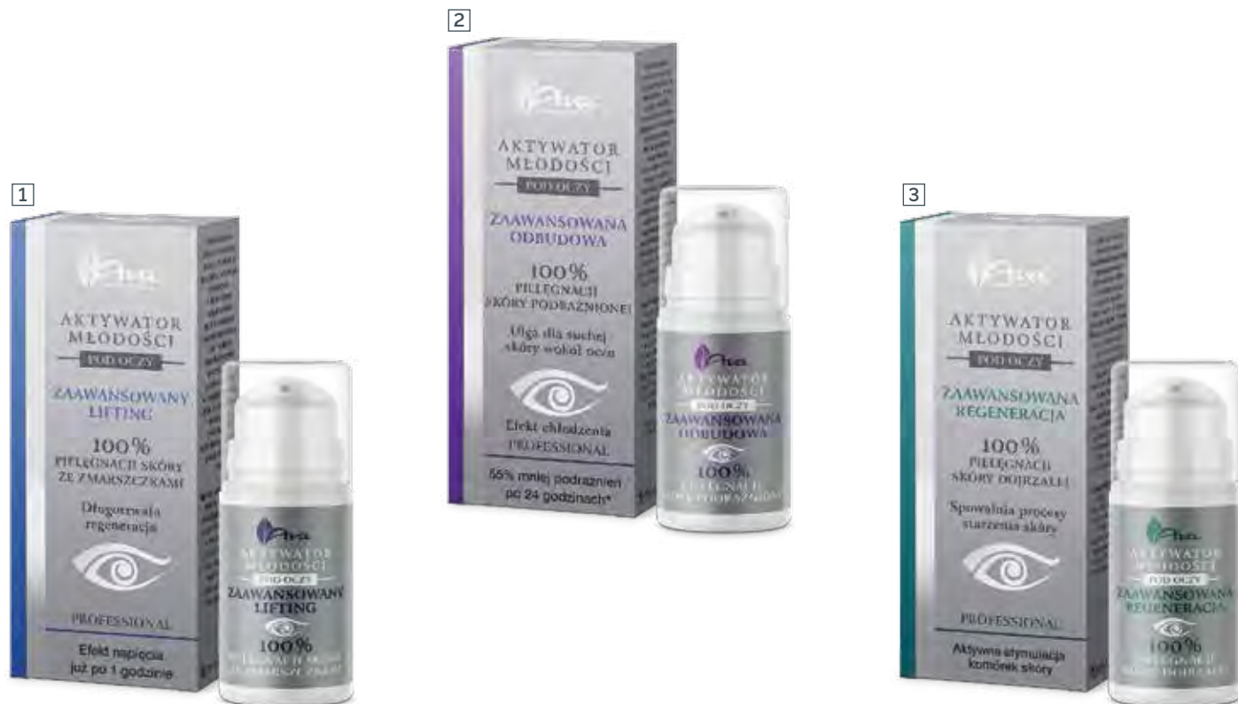
1 ZAAWANSOWANY LIFTING 15 ml • indeks 5270

PRZEZNACZONE DO PIELĘGNACJI SKÓRY POD OCZAMI Z WIDOCZNYMI ZMARSZCZKAMI, PODRAŻNIONEJ I ZACZERWIENIONEJ ORAZ DOJRZAŁEJ.