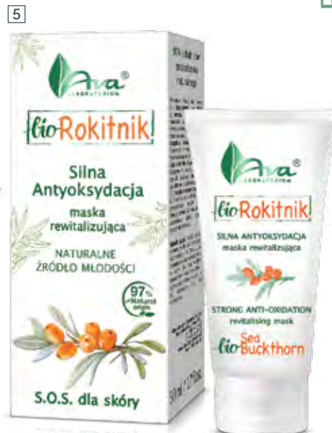
5 MASKA REWITALIZUJĄCA SILNA ANTYOKSYDACJA 50 ml • indeks 6130