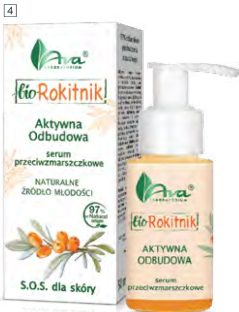
4 SERUM PRZECIWMARSZCZKOWE AKTYWNA ODBUDOWA 50 ml • indeks 6154