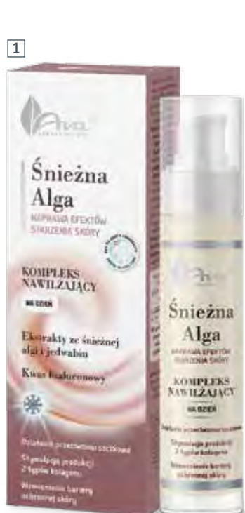
1 KOMPLEKS NAWILŻAJĄCY NA DZIEŃ 50 ml • indeks 5300