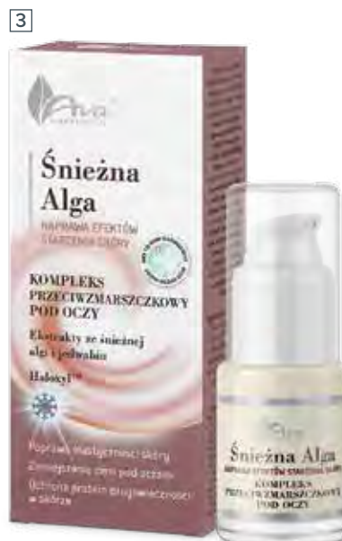
3 KOMPLEKS PRZECIWMARSZCZKOWY POD OCZY 15 ml • indeks 5324