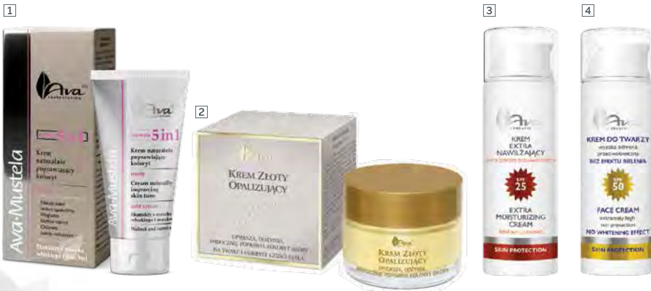
1 KREM NATURALNIE POPRAWIAJĄCY KOLORYT 5 W 1 30 ml • indeks 0602

IDEALNE DLA KAŻDEGO TYPU SKÓRY W KAŻDYM WIEKU.