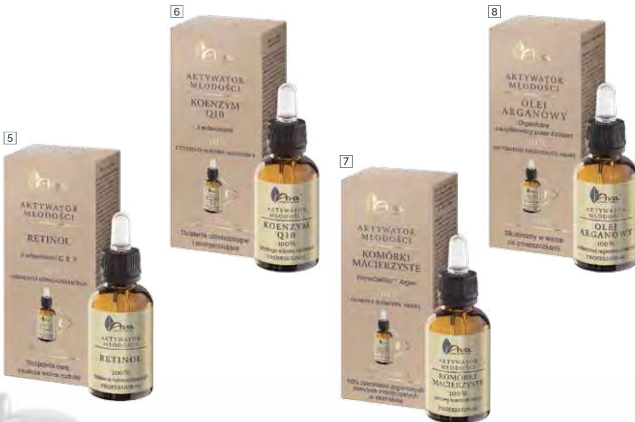
5 RETINOL Z WITAMINAMI C, E, F 30 ml • indeks 4891