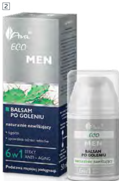
2 BALSAM PO GOLENIU NATURALNIE NAWILŻAJĄCY 6 W 1 50 ml • indeks 5140