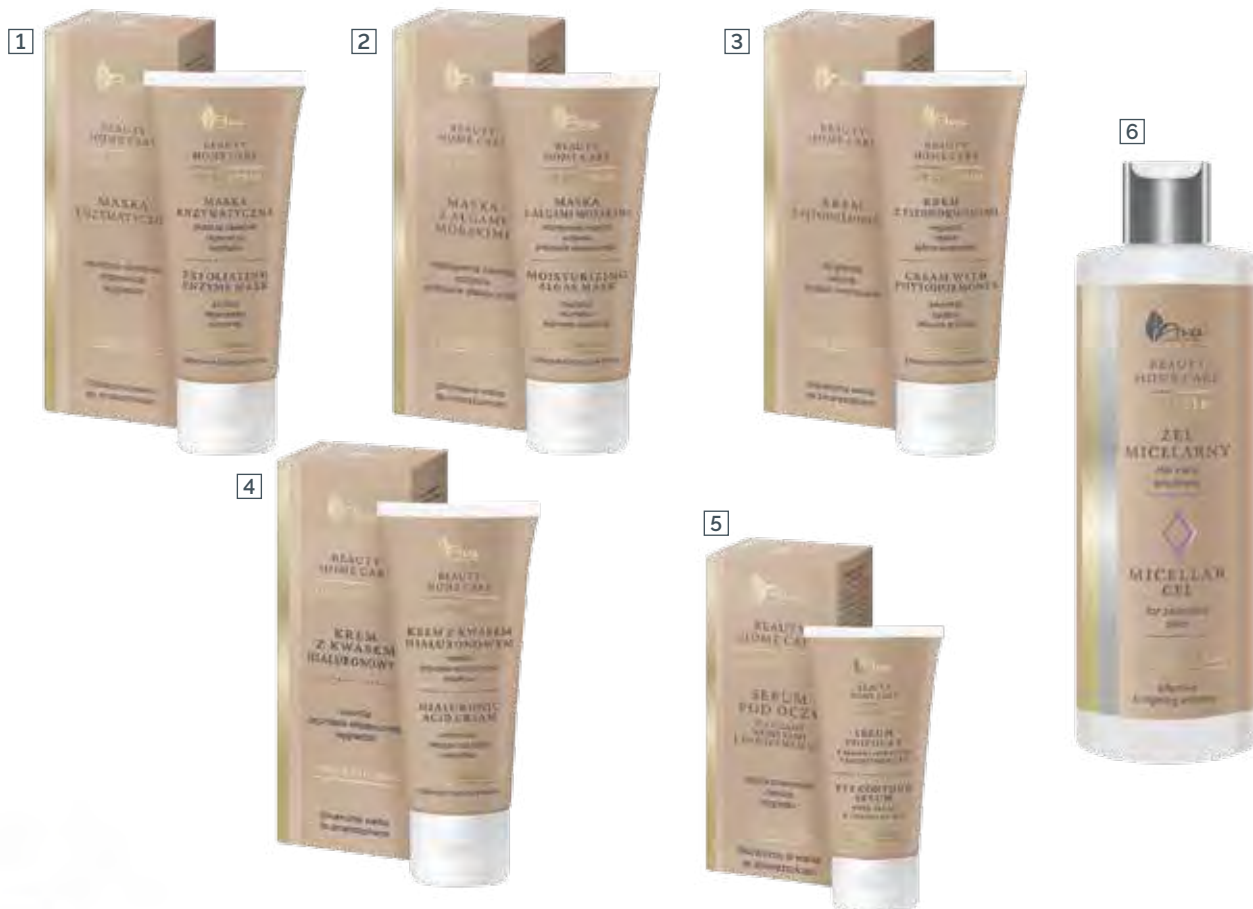
1 MASKA ENZYMATYCZNA 100 ml • indeks 3948