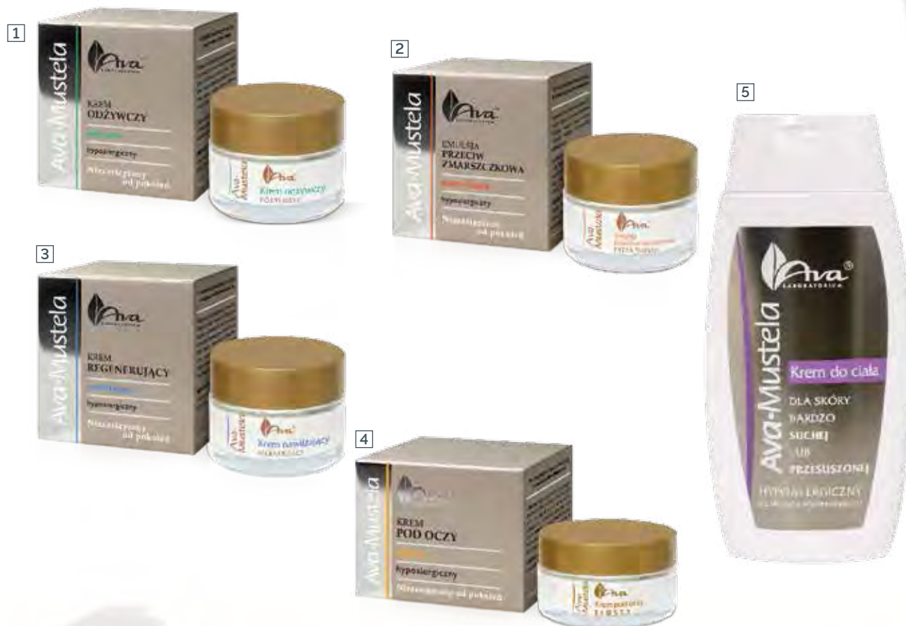
1 KREM ODŻYWCZY 50 ml • indeks 0237

IDEALNE DLA CERY WRAŻLIWEJ, WYSUSZONEJ, SKŁONNEJ DO ALERGI I ATOPOWEJ PO 45 ROKU ŻYCIA.