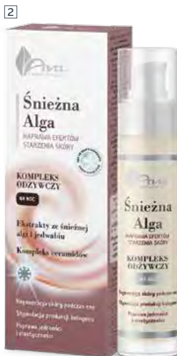
2 KOMPLEKS ODŻYWCZY NA NOC 50 ml • indeks 5317