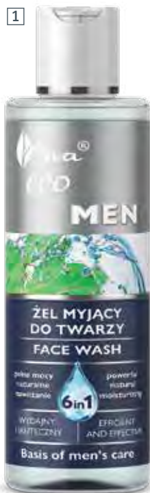
1 ŻEL MYJĄCY DO TWARZY I CIAŁA 6 W 1 200 ml • indeks 5133

PRZEZNACZONY DO PIELĘGNACJI WSZYSTKICH TYPÓW MĘSKIEJ SKÓRY.