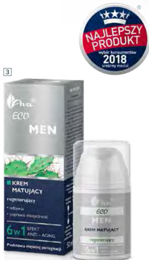
3 KREM MATUJĄCY REGENERUJĄCY 50 ml • indeks 5157