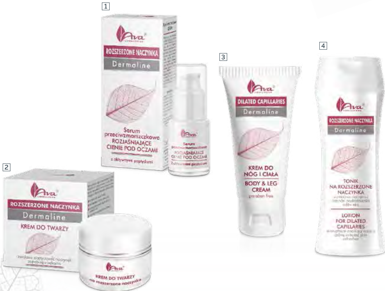
1 SERUM PRZECIWMARSZCZKOWE ROZJAŚNIAJĄCE CIEŃ POD OCZAMI 15 ml • indeks 0664

IDEALNE DO PIELĘGNACJI SKÓRY Z PROBLEMAMI PĘKAJĄCYCH I ROZSZERZONYCH NACZYNEK.